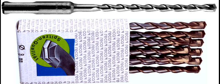
Foret béton reca Rapid Référence : 0648 0.. ..1 De 5mm à 14mm (uniquement par paquet de 10 pièces)