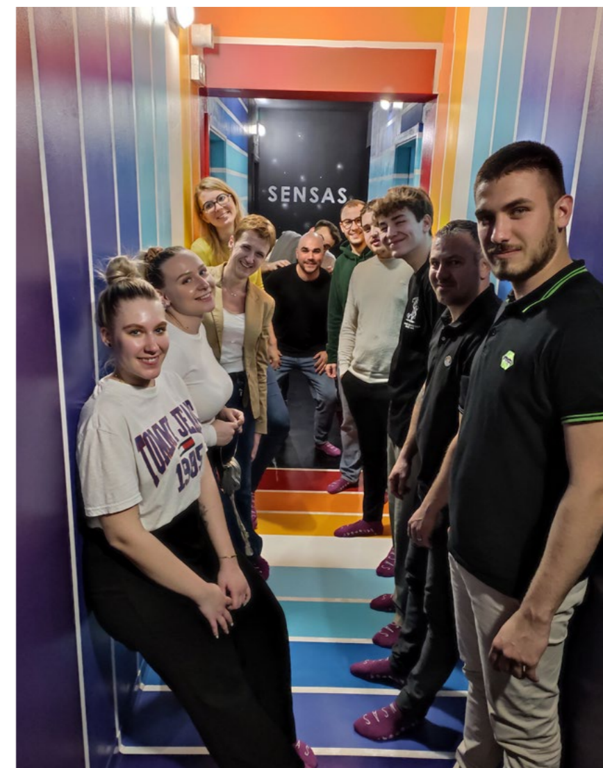
Sortie des alternants et des tuteurs