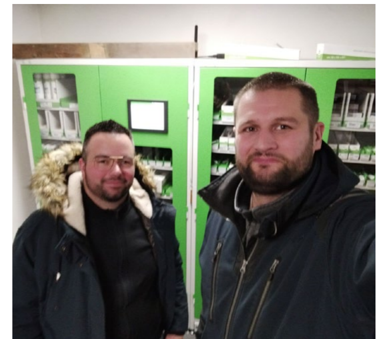
Participation au DUODAY 2024