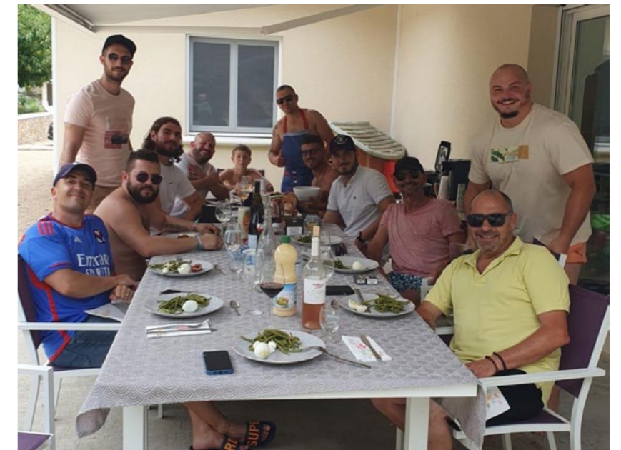
Week-end Région 11