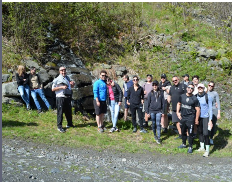
Week-end Région 7