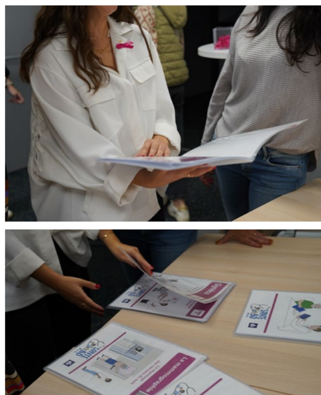
Atelier de sensibilisation contre le cancer du sein