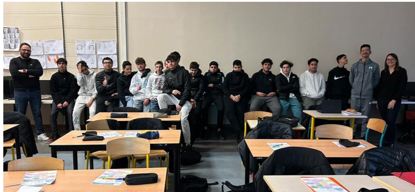
Les entreprises pour la cité