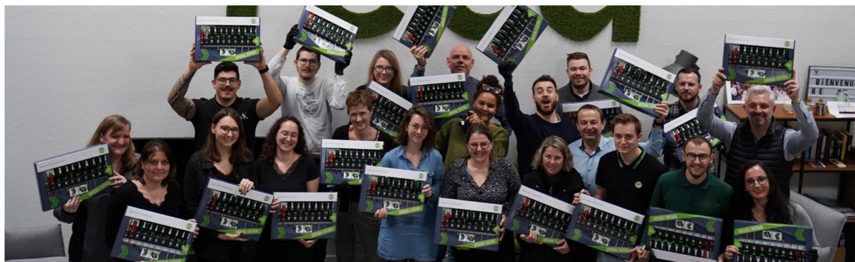
Tournée Work Out 2024