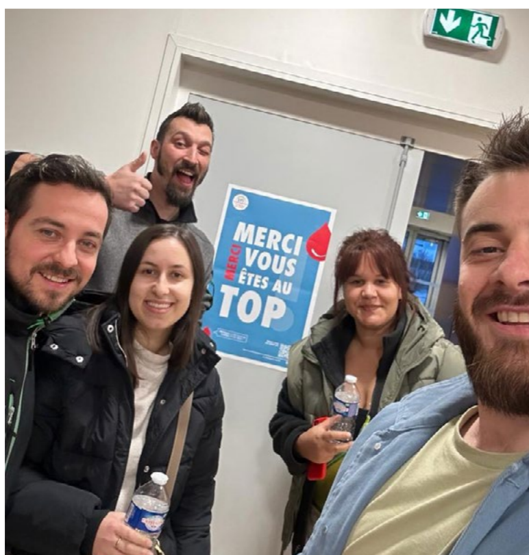
Don du sang