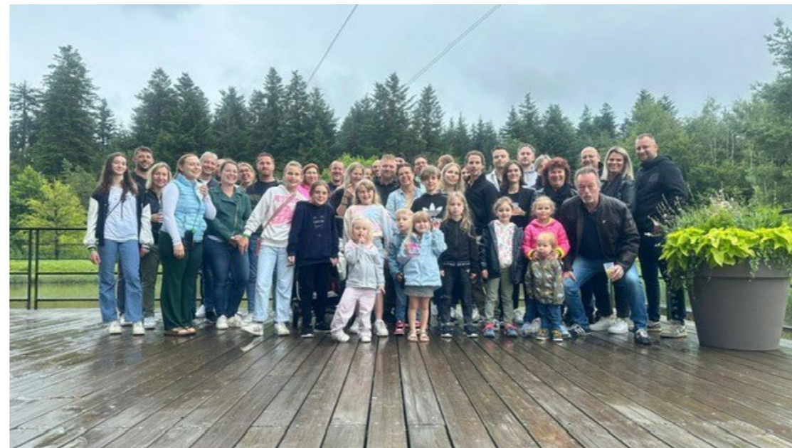
Week-end Région 1 à Center Parc