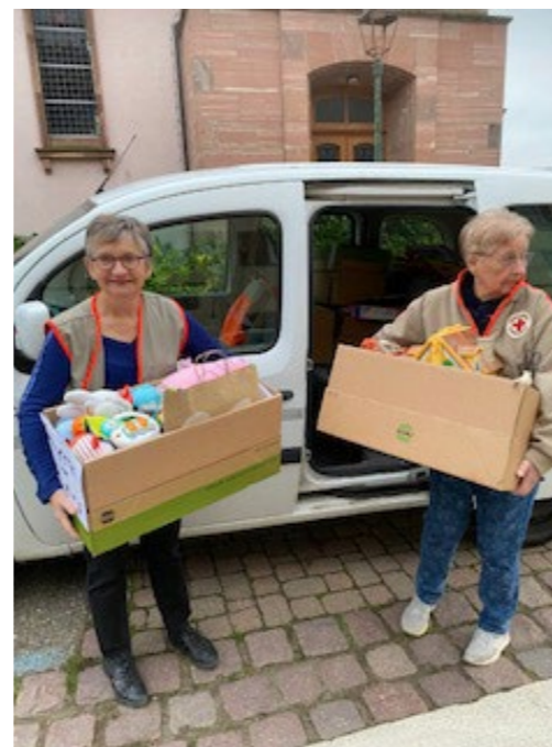
Collecte de jouets avec la Croix Rouge